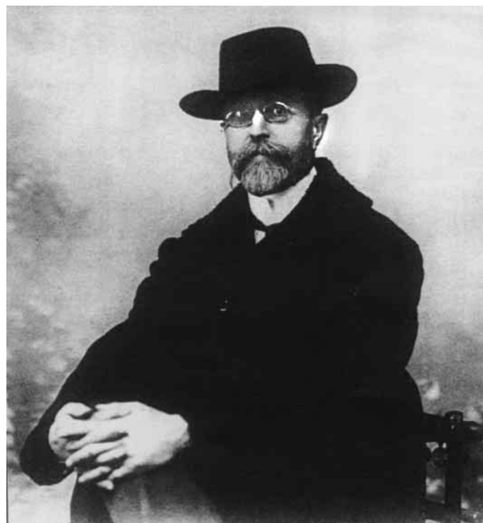
TGM v době, kdy Parmovice navštívil

Bohužel, přes usilovné a systematické pátrání, ve