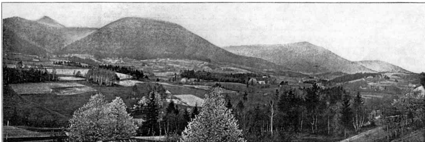
Pohled na panorama hor z hotelu a lázní

Přístup severnímu větru zamezuje Ondřejník (964 m) a vzduch čistý, ozonem prosycený jest pln kořeněné vůně. Kolem lázní zřízeny jsou úpravné promenády a krásné letní procházky, zejména na hory. Ústav tento hodí se dobře jako místo léčebné a klimatické.