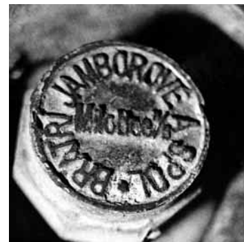
Náboj kola bryčky