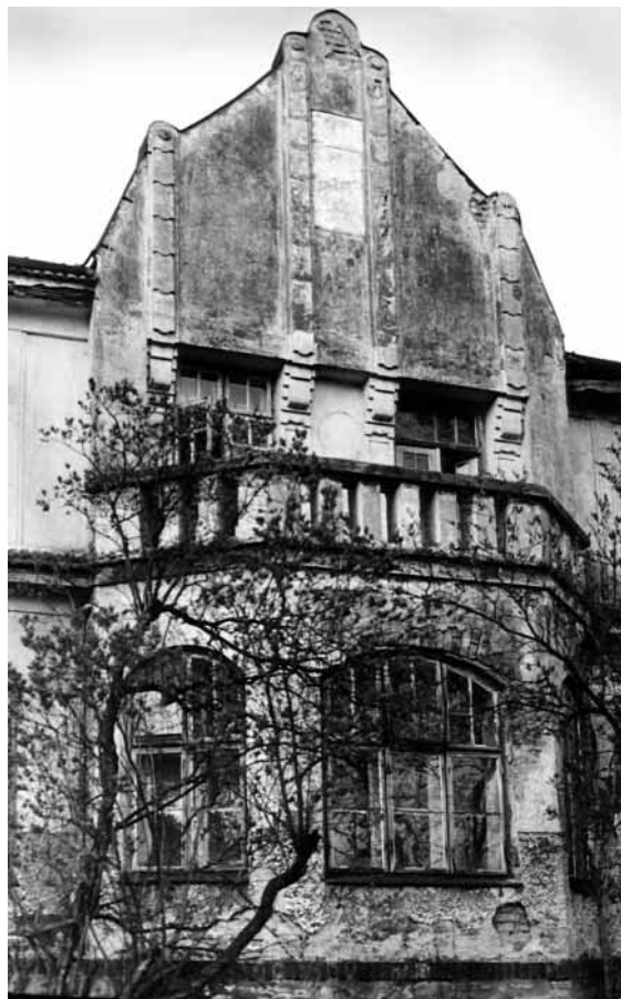
Jídelna, okna v přízemí — dnešní stav

Jídelna léčebny byla největší místností v přízemí objektu. Byla zbudována z chodby (síně) a části výčepu bývalého zájezdního hostince. Měla rozlohu 28,5 m 2 a sloužila zároveň také jako čítárna,