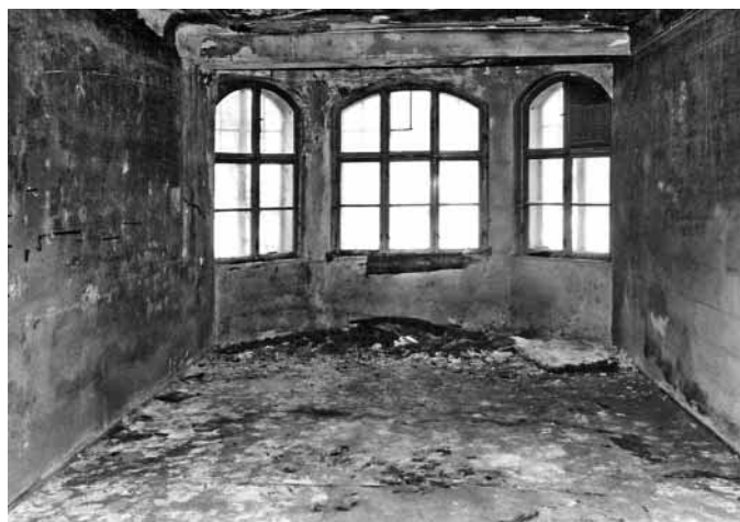
Interiér jídelny — dnešní stav