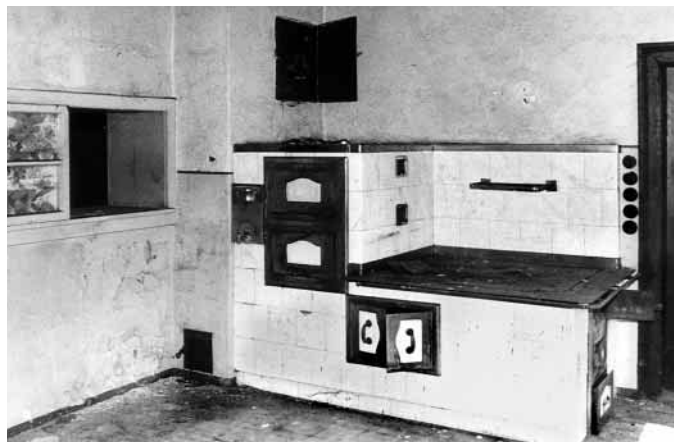
Kuchyně léčebny — současný stav