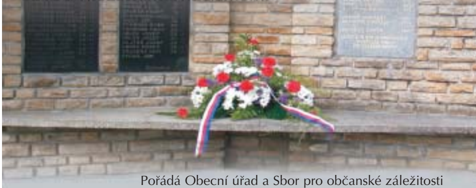
Pořádá Obecní úřad a Sbor pro občanské záležitosti

Obecní úřad v Kunčicích pod Ondřejníkem a Sbor pro občanské záležitosti Vás srdečně zvou v pondělí 5. května 2008 v 16.00 hod na vzpomínkovou slavnost v prostorách před obecním úřadem u příležitosti 63. výročí osvobození naší obce a vítězství nad nacismem.