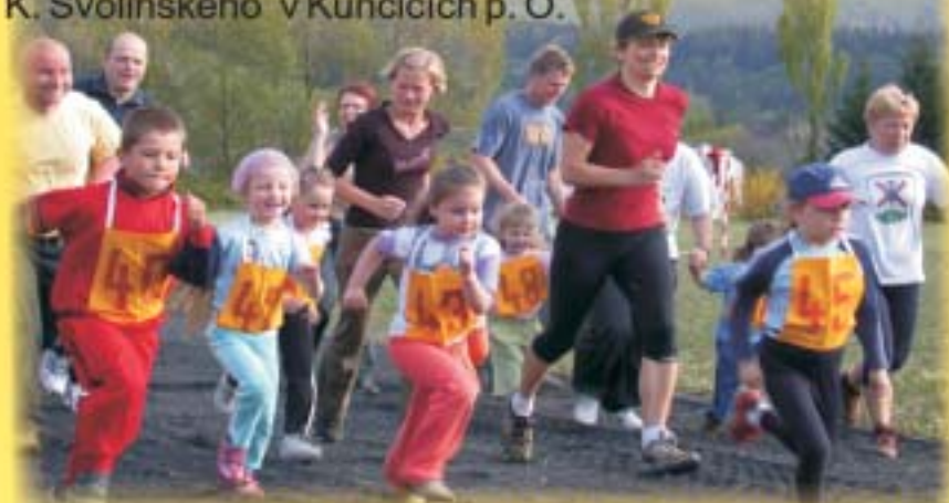
Srdečně zve Komise pro školství, sport a cestovní ruch.

Po ukončení vzpomínkové slavnosti proběhne k výročí osvobození naší obce II. ročník štafetového běhu „Kunčický ovál“ . Začátek v 17,00 hod u Základní školy K. Svolinského v Kunčicích p. O.