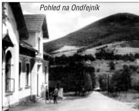
Pohled na Ondřejník