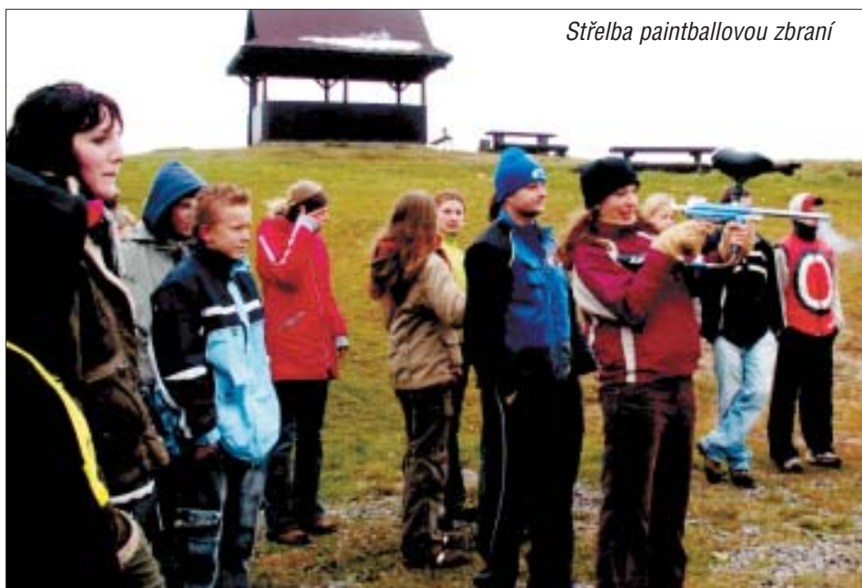
Střelba paintballovou zbraní

vedení slepců, při vytvoření hvězdy spojováním švihadel, při skládání puzzle a hledání společného rýmu, při vzájemném seřazení poslepu od největšího po nejmenšího. Dále žáci plnili úkoly vyžadující tělesnou zdatnost např. „škubání bažanta“, pohyblivý fotbal, zde nás bohužel omezovala nepřízeň počasí a úkoly, které potřebovaly zručnost např. střelba z paintballové zbraně na cíl či jízda na simulátoru automobilové rally. Za poslední zmiňované a pro děti často nevhodné aktivity jsme vděční majiteli penzionu Búřov, kde jsme byli ubytováni, který dětem krom těchto soutěží uspořádal i velmi pěknou diskotéku. Ze zpětných reakcí žáků usuzujeme, že se jim akce líbila a doufáme, že i další třídy využijí podobných pobytů k navození správné pracovní atmosféry v kolektivu.